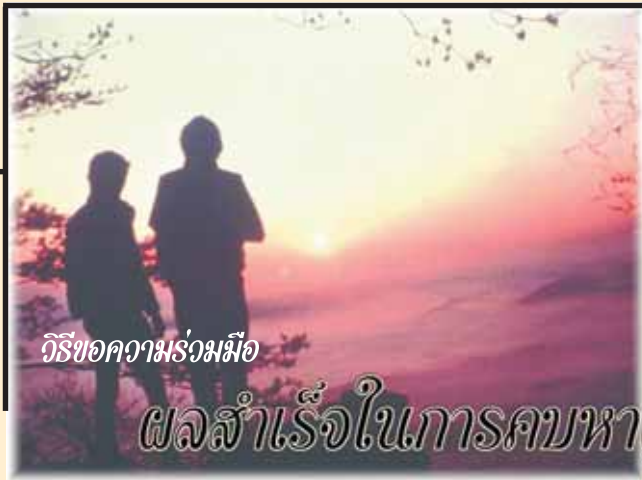
วิถีขอความร่วมมือ

โดยมอบทางเลือกเสมอ และให้เป็นไปด้วยความสมัครใจ ถ้าหากเป็นไปได้